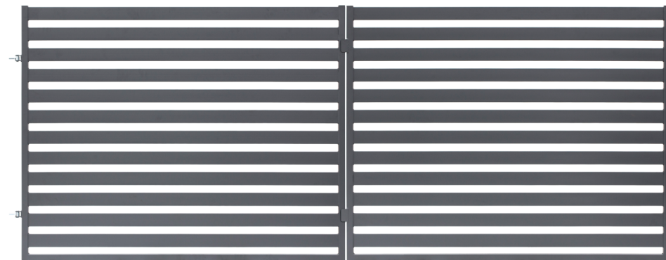
SLAGGRIND (VÄNSTER & HÖGER) 1,50 x 4,00 m